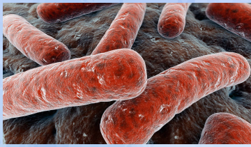
ภาพเชื้อแบคทีเรีย mycobaterium tuberculosis