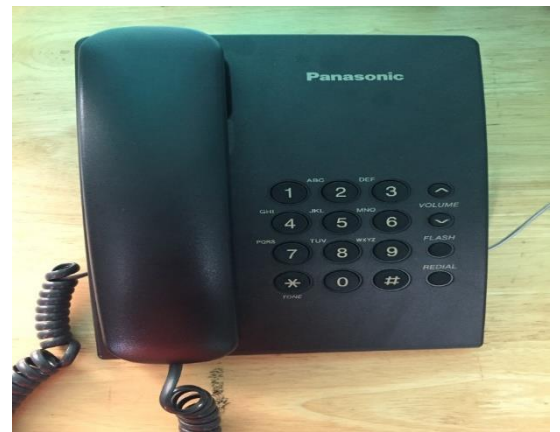
ร้องเรียนผ่านโทรศัพท์สำนักงาน เบอร์ ๐ ๗๗๓๙ ๙๐๑๔