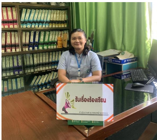
ยื่นข้อร้องเรียนด้วยตนเองกับเจ้าหน้าที่